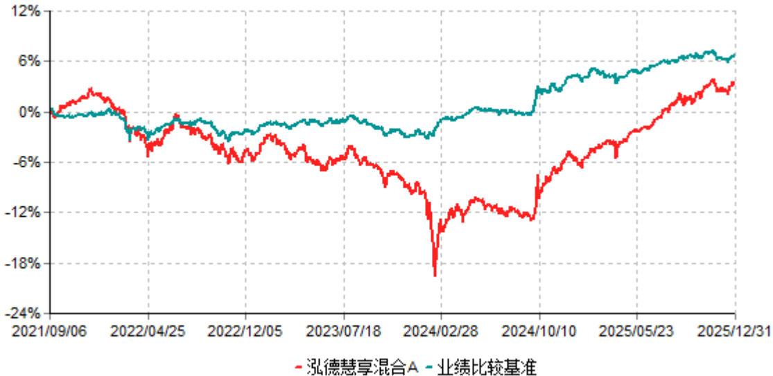
泓德慧享混合A累计净值增长率与业绩比较基准收益率历史走势对比图 (2021年09月06日-2025年12月31日)