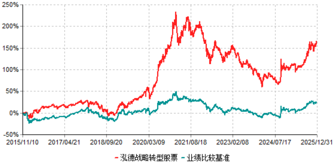
泓德战略转型股票累计净值增长率与业绩比较基准收益率历史走势对比图 (2015年11月10日-2025年12月31日)

注：根据基金合同的约定，本基金建仓期为6个月，截至报告期末，本基金的各项投资比例符合基金合同关于投资范围及投资限制规定。