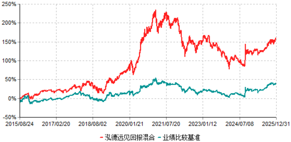
泓德远见回报混合累计净值增长率与业绩比较基准收益率历史走势对比图 (2015年08月24日-2025年12月31日)

注：根据基金合同的约定，本基金建仓期为6个月，截至报告期末，本基金的各项投资比例符合基金合同关于投资范围及投资限制规定。