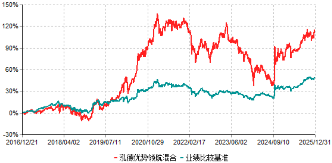
泓德优势领航混合累计净值增长率与业绩比较基准收益率历史走势对比图 (2016年12月21日-2025年12月31日)

注：根据基金合同的约定，本基金建仓期为6个月，截至报告期末，本基金的各项投资比例符合基金合同关于投资范围及投资限制规定。