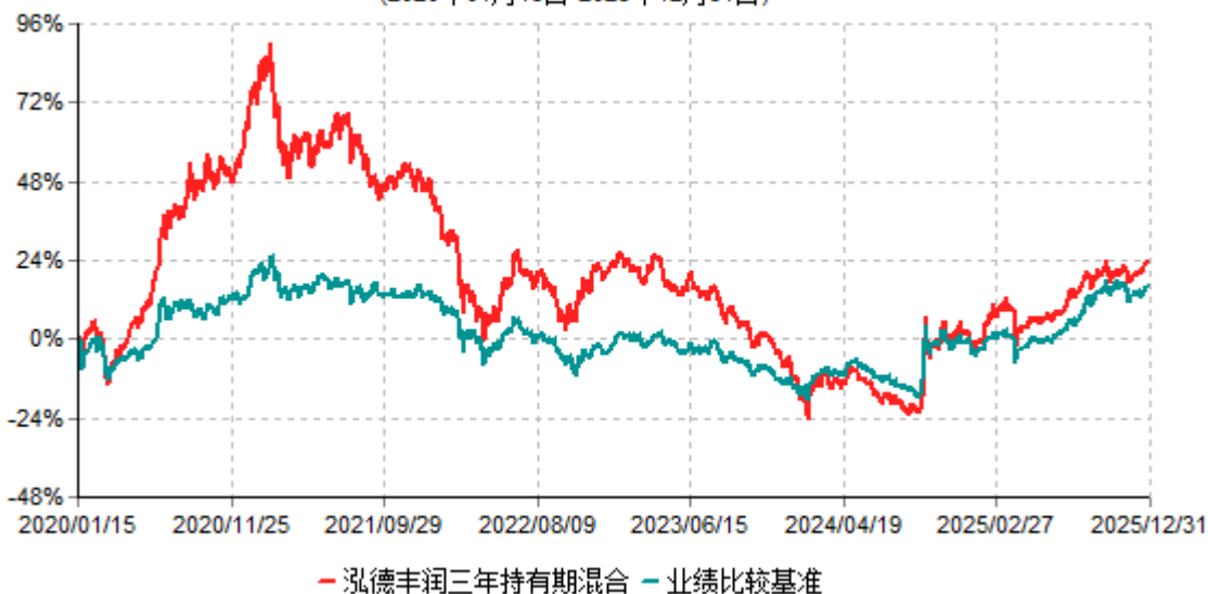
泓德丰润三年持有期混合累计净值增长率与业绩比较基准收益率历史走势对比图 (2020年01月15日-2025年12月31日)

注：根据基金合同的约定，本基金建仓期为6个月，截至报告期末，本基金的各项投资比例符合基金合同关于投资范围及投资限制规定。