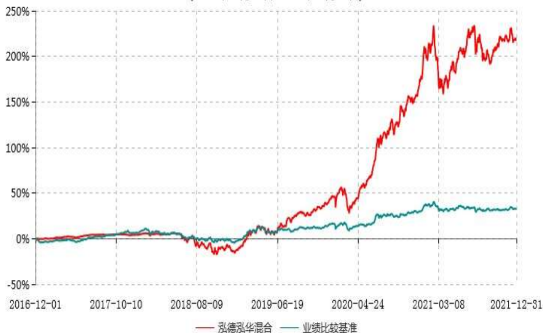
泓德泓华灵活配置混合型证券投资基金累计净值增长率与业绩比较基准收益率历史走势对比图 (2016年12月01日-2021年12月31日)

注：根据基金合同的约定，本基金建仓期为6个月，截至报告期末，本基金的各项投资比例符合基金合同关于投资范围及投资限制规定。