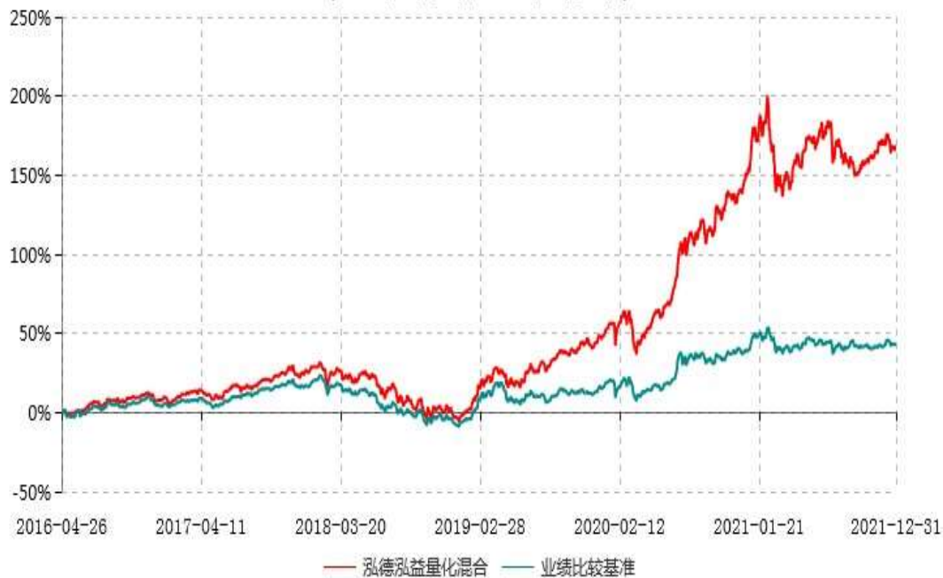
泓德泓益量化混合型证券投资基金累计净值增长率与业绩比较基准收益率历史走势对比图 (2016年04月26日-2021年12月31日)

注：根据基金合同的约定，本基金建仓期为6个月，截至报告期末，本基金的各项投资比例符合基金合同关于投资范围及投资限制规定。