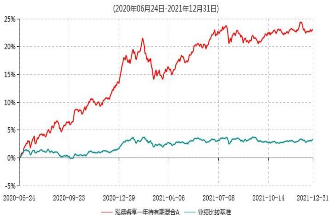
泓德睿享一年持有期混合A累计净值增长率与业绩比较基准收益率历史走势对比图