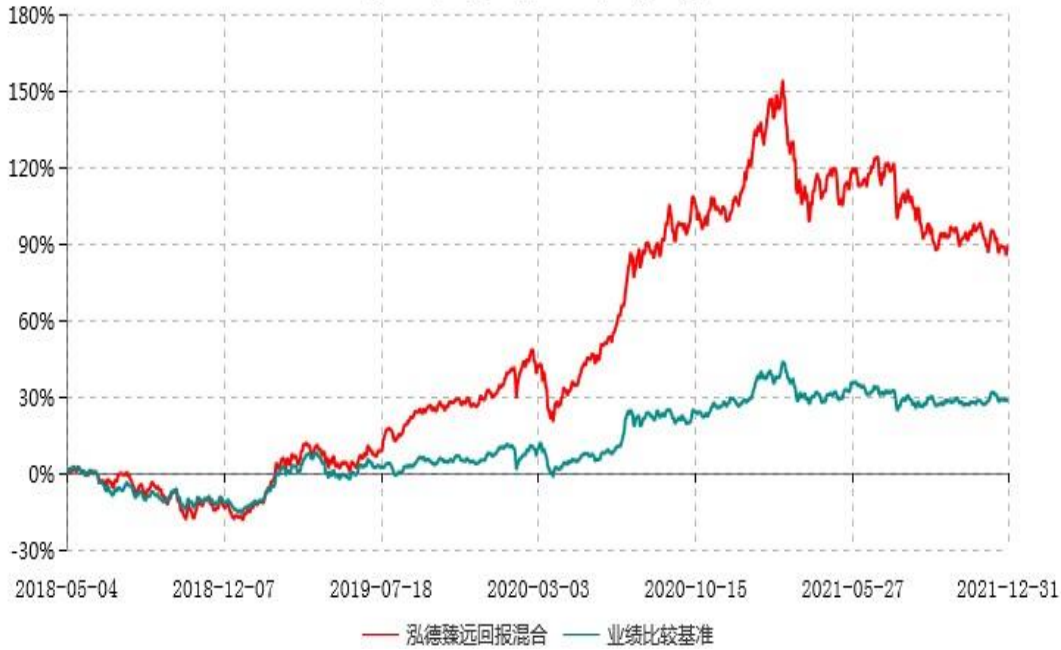
泓德臻远回报灵活配置混合型证券投资基金累计净值增长率与业绩比较基准收益率历史走势对比图 (2018年05月04日-2021年12月31日)

注：根据基金合同的约定，本基金建仓期为6个月，截至报告期末，本基金的各项投资比例符合基金合同关于投资范围及投资限制规定。