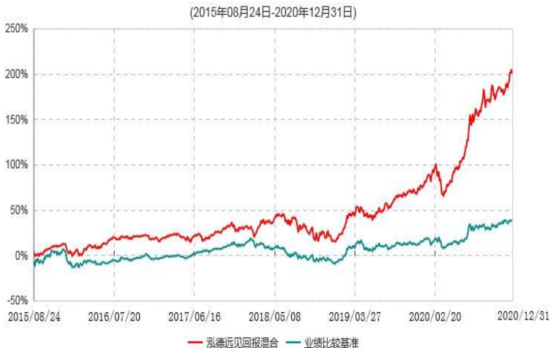
泓德远见回报混合型证券投资基金累计净值增长率与业绩比较基准收益率历史走势对比图

注：根据基金合同的约定，本基金建仓期为6个月，截至本报告期末，本基金的各项投资比例符合基金合同关于投资范围及投资限制规定。