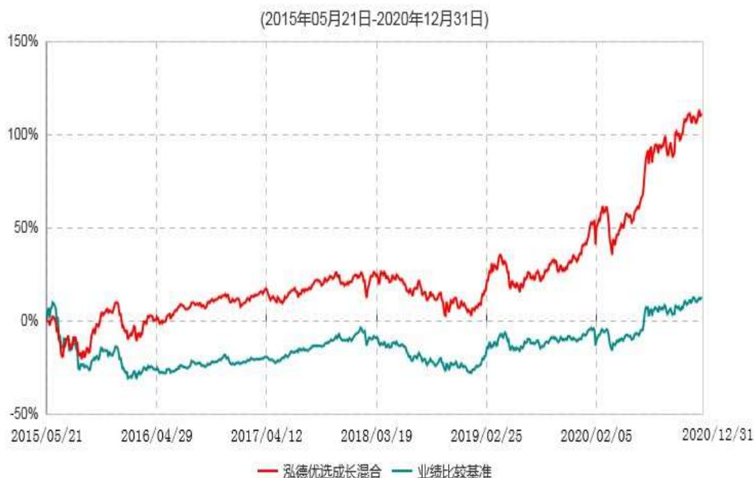
泓德优选成长混合型证券投资基金累计净值增长率与业绩比较基准收益率历史走势对比图

注：根据基金合同的约定，本基金建仓期为6个月，截至报告期末，本基金的各项投资比例符合基金合同关于投资范围及投资限制规定。