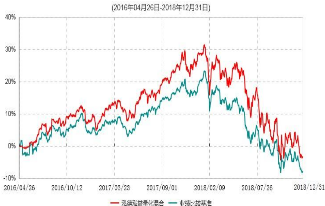
泓德泓益量化混合型证券投资基金累计净值增长率与业绩比较基准收益率历史走势对比图